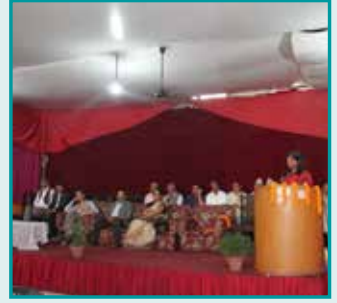
वार्षिक साधारण सभा