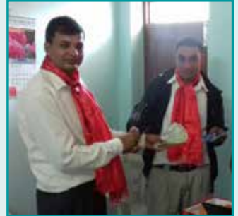
वचत संकलनको सुरुवात