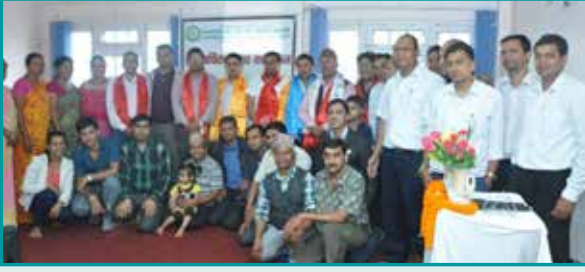
वार्षिक उत्सव कार्यक्रम, आषाढ ५, २०७३