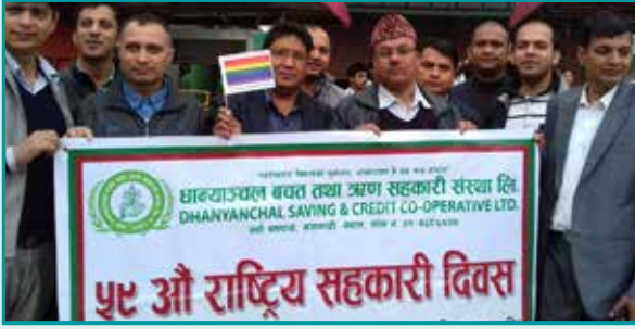
अन्तराष्ट्रिय सहकारीदिवसमा सहभागीता