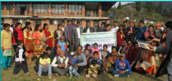
अवलोकन कार्यक्रम, नुवाकोट