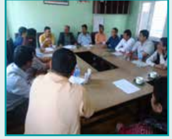
स्थापनार्थ पहिलो बैठक