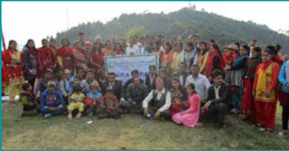
वनभोज कार्यक्रम, ककनी, २०७३